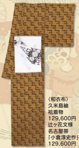
〈和衣布〉 久米島紬 袷着物 129,600円 辻ヶ花文様 名古屋帯「小倉淳史作」 129,600円