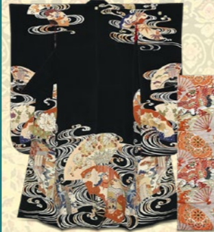
↑〈きものくろ〜ぜっと〉 アンティーク振袖 102,600円 丸帯 162,000円