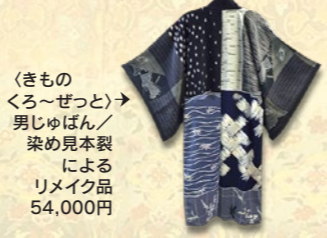
〈きものくろ〜ぜっと〉 男じゅばん/染め見本裂によるリメイク品 54,000円