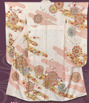
振袖 〈きもの今昔処 和楽市〉 振袖(長じゅばん付) 172,800円