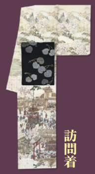
訪問着 〈きものくろ〜ぜっと〉 平安京風俗絵巻図 訪問着 108,000円 「菱屋善兵衛謹製」袋帯 64,800円