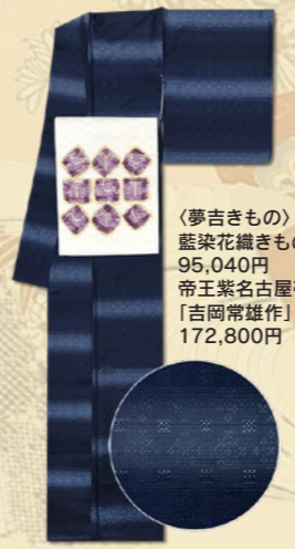
〈夢吉きもの〉 藍染花織きもの 95,040円 帝王紫名古屋帯「吉岡常雄作」 172,800円