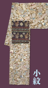
小紋 〈きもの今昔処 和楽市〉 辻ヶ花文様 小紋(未使用品) 140,400円 「菅田屋源兵衛謹製」袋帯 140,400円