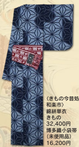
〈きもの今昔処 和楽市〉 綿紺単衣 32,400円 きもの博多織小袋帯(未使用品) 16,200円