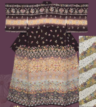
訪問着 〈きものくろ〜ぜっと〉 訪問着 86,400円 袋帯 35,640円