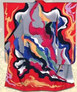
〈夢吉きもの〉 岡本太郎図案 振袖(長じゅばん付) 496,800円