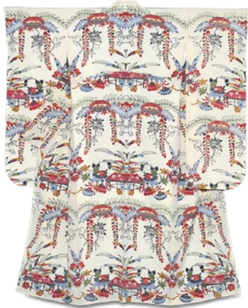
振袖 紅型振袖 税込 91,800円 [きもの CITY]

秋口から年末年始にかけての フォーマルシーズンに向けて 用途に合わせてご用意いたします