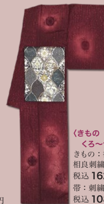
〈きもの くろ〜ぜっと〉 きもの：徳扇 相良刺繍 袖付下 税込 162,000 円 帯：刺繍袋帯 税込 108,000 円