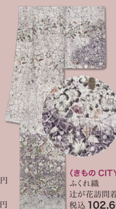
〈きもの CITY〉 ふくれ織 辻が花訪問着 税込 102,600 円