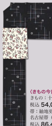
〈きもの今昔処 和楽市〉 きもの：十日町袖 税込 54,000 円 帯：袖地更紗染 名古屋帯 (未使用品) 税込 86,400 円