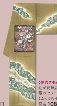
〈夢吉きもの〉 辻が花風訪問着と 帯のセット (ふっくらす) 税込 108,000 円