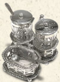
〈グローリー〉 純銀 3 種調味料入れ (ソルト、ペッパー & マスタード) 税込 48,600 円