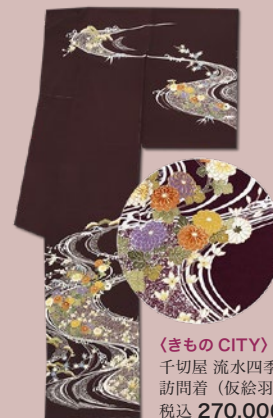
〈きもの CITY〉 千切屋 流水四季花 訪問着 (仮絵羽) 税込 270,000 円