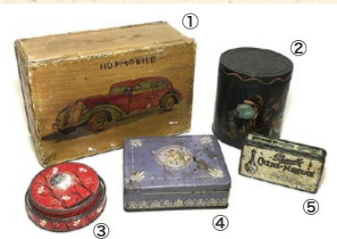
〈アンティークモール銀座〉