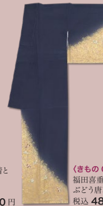
〈きもの CITY〉 福田喜重 ぶどう唐草文訪問着 税込 486,000 円