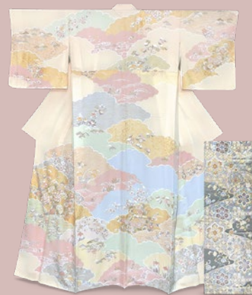
〈きもの今昔処 和楽市〉 きもの：京友禅訪問着 (未使用品) 税込 108,000 円 帯：西陣袋帯 税込 32,400 円

東京・関西のリサイクル着物の名店 4 店が集結。訪問着、振袖、留袖など フォーマルの着物から細まで多彩な品揃えでお待ち申し上げます。