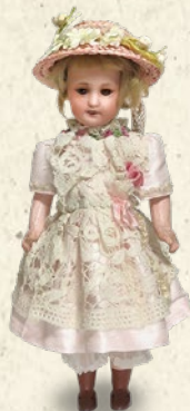
〈ジョリプロカント〉 【S.F.B.J.】ビスクドール 税込 54,000 円 (H26.5cm)