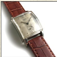
〈BQ〉 【GRUEN】メンズウォッチ 税込 64,800 円