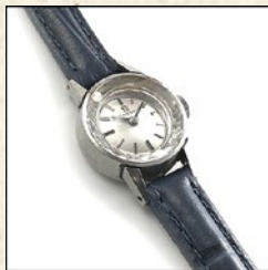
〈BQ〉 【OMEGA】レディースウォッチ 税込 64,800 円