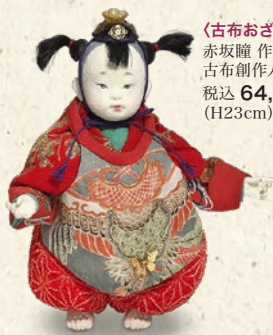
〈古布おざき〉 赤坂隆作 古布創作人形「童子」 税込 64,800 円 (H23cm)