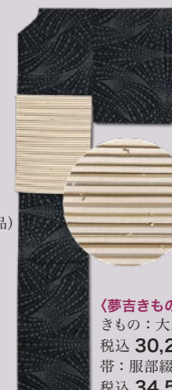
〈夢吉きもの〉 きもの：大島袖 税込 30,240 円 帯：服部綴名古屋帯 税込 34,560 円