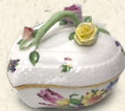
〈アンティーク モール銀座〉 【HEREND】 小物入れ 税込 38,880 円