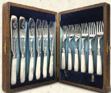
〈アンティーク DORIS〉 マザーオブパール・ハンドル ナイフ&フォーク 12 本セット (ケース付き) 税込 48,600 円 (ナイフ L20cm / フォーク L16.5cm)