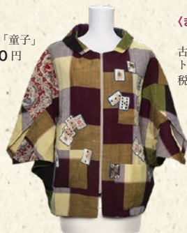
〈きもの くろ〜ぜっと〉 古布リメイクの洋服 トランプ柄ブルゾン 税込 54,000 円