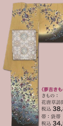
〈夢吉きもの〉 きもの： 花唐草訪問着 税込 38,880 円 帯：袋帯 税込 34,560 円