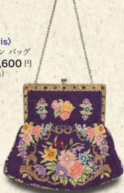
〈47.Paris〉 プチポアン バッグ 税込 75,600 円 (W24cm)