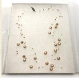
パール・ネックレス 出品: フィガロショップ