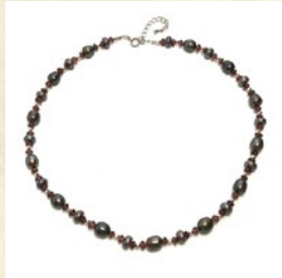
パール・ガーネット・ ネックレス 出品: フィガロショップ