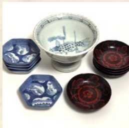
古伊万里盃洗/古伊万里六角 小皿(5枚)/吉野塗木皿(5枚) 出品: ぎゅらりい浅羽