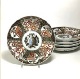
色絵五寸皿 (5枚) 出品: JapaneseGallery Ginza Seiyodo