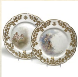
フランス手描絵皿 2枚組 出品: アンティークモール銀座