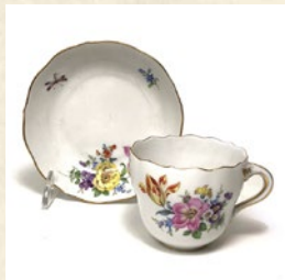
マイセン C&S 出品: アンティークモール銀座