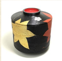
漆器丸重 出品: JapaneseGallery Ginza Seiyodo