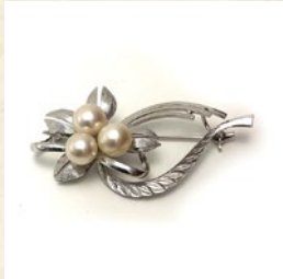
パール・ブローチ 出品: フィガロショップ