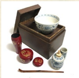
桑茶箱セット (安南写し茶碗 セット、朱時絵3点セット) 出品: ケース C1 治里也