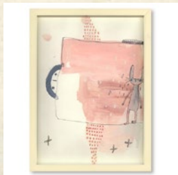
「Peeper」 呉亜沙作 ドーイング 出品: ケース A14 伊万里絵