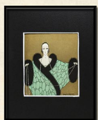
↑<アンティークス セレノ> アール・デコ ファッションプレート (額装サイズ W22×H27.5cm) 48,600 円

※価格は全て税込です。 ※掲載商品はいずれも現品限りとさせていただきます。 ※数に限りがございますので売切れの際はご容赦下さい。