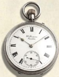
←<アンティークモール銀座> (J.W. ベンソン) 懐中時計 (W5×H7cm) 97,200 円