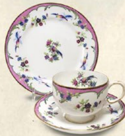
↑<アンティークモール銀座> (パラゴン) カップ&ソーサーと ケーキ皿のトリオ (カップ口径8×H6cm / ソーサー直径13.5cm / ケーキ皿直径17cm) 21,600 円