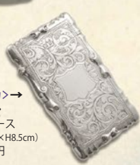
<アミーカ>→ シルバー・ カードケース (W4.8×D8×H8.5cm) 97,200 円