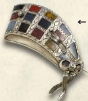
←<ベルネージュ> スコティッシュ・ブローチ (シルバー・メノウ/W6.5×D4cm) 270,000 円