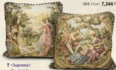
↑<Supreme> クッション (表：ゴブラン織 / 裏：ペロア W40×H40cm) 各税込 11,880 円