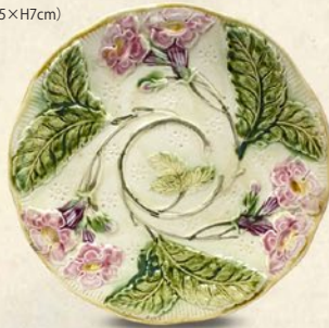
↑<PTジャンク> バルボティーヌ・プレート (直径21cm) 7,344 円