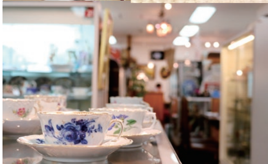
※2018年1月より年中無休(一部店舗を除く) Open all year round except new year.