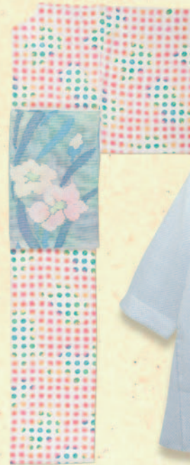
← (きもの) 紹小紋 税込 50,760 円 (帯) 羅 八寸名古屋帯 税込 30,240 円 (きもの今昔処和楽市)

6月10日(水)~16日(火) ※最終日午後5時閉場 山陽百貨店 本館6階 催し会場