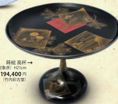
蒔絵高杯→ (9世/西村象彦) H21cm 税込 194,400 円 (竹内彩古堂)