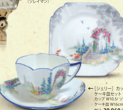
← [シェリー] カップ&ソーサー、 ケーキ皿セット カップ W10.5/ソーサー W13/ ケーキ皿 W16cm 税込 39,960 円 (ローズコテージ)