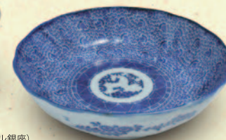
↑ 印判なます皿 口径14.7cm 税込 3,240 円 (アンティークモール銀座)