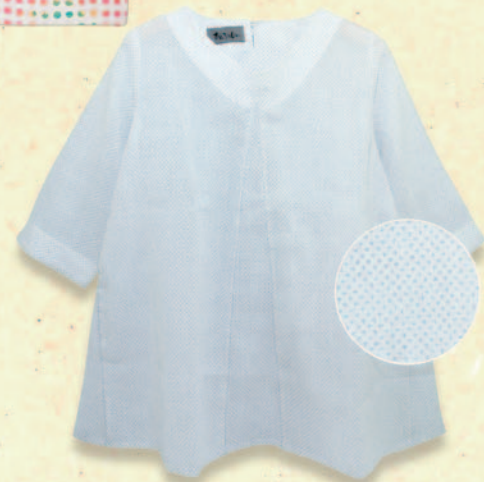
↓ 白紬のチュニック (古布リメイク) MLサイズ/麻 税込 23,760 円 (横櫛樹)