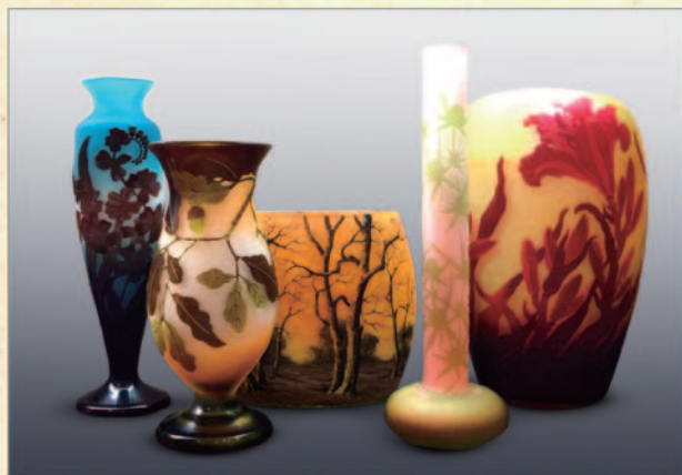
↑ アールヌーヴォーのガラス花瓶 各種 税込 378,000 円より (アンティークアイ)