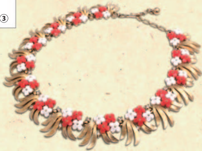
↑ [トリファリ] ネックレス 税込 91,800 円 (SABRINA)