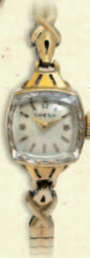
← [オメガ] レディスウォッチ K14YG 税込 225,000 円 (ソレイマン)