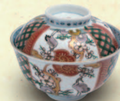
↑ 蓋つき茶碗 口径11.5cm 税込 5,400 円 (アンティークモール銀座)