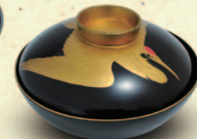
↑ 蓋つき漆器碗 口径12.7cm 税込 7,020 円 (アンティークモール銀座)